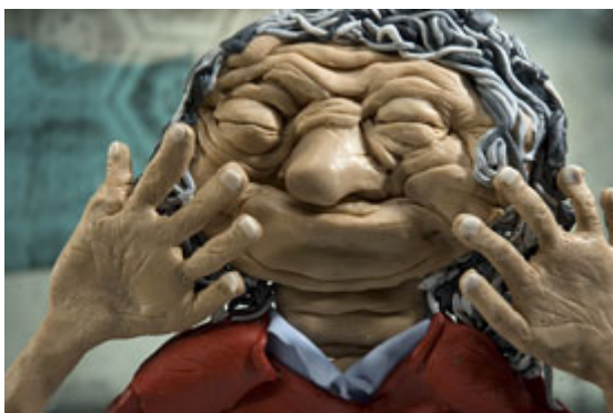
Min bestemor Beijing (regi: Mats Grorud 2008) og