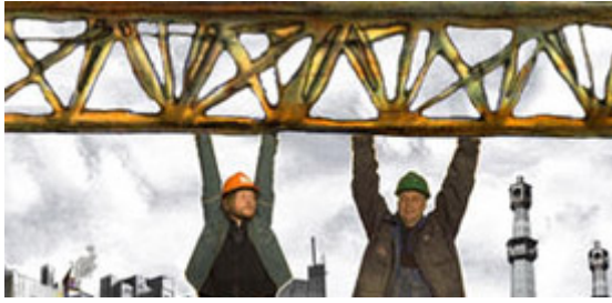
Filmene er Bygningsarbeidere(regi: Kaja Næss 2008),

Denne kvelden syner me 6 norske kortfi lmar frå dei siste tre åra, mellom anna prisvinnerar frå festivalane i Grimstad og Cannes.